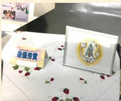
法人ロゴマークには、他にもたくさんの応募がありました