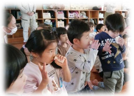
木育 講師の方から「木」についていろいろなことを教えてもらいました