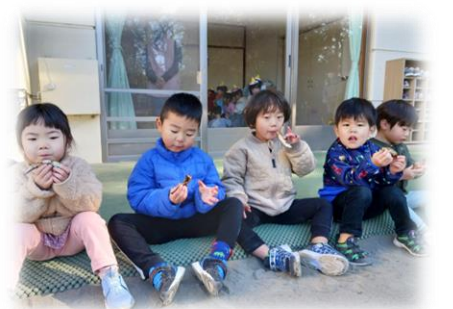
豆まき そう組ときりん組が前日から豆炒りとやいかがしの準備をしてくれました