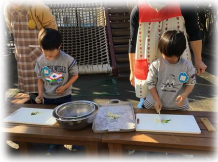
七草がゆ作り 歌いながら七草を刻みました