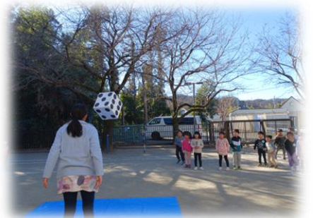
お正月遊び 幼児クラス合同カルタ大会 ビッグ福笑い(いす うさぎ) 人間すごろく(きりん そう)