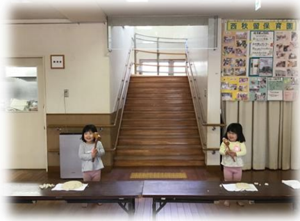
鏡開き 今年頑張りたいことを宣言しながらお餅を割りました