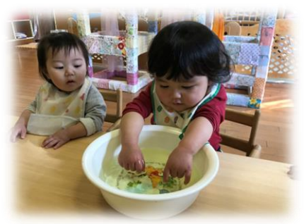
七草のゆで汁に爪を浸して今年1年の健康を願いました